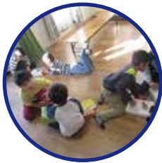
ふだんはこんな感じ