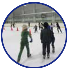
夏休み中のスケート遠足

[注] 上記は平成30年度の見込み金額です。在所児童数の増減に伴う市補助金の変更、家賃の変更などによって、保育料が変更となる場合がありますので、予めご了承ください。